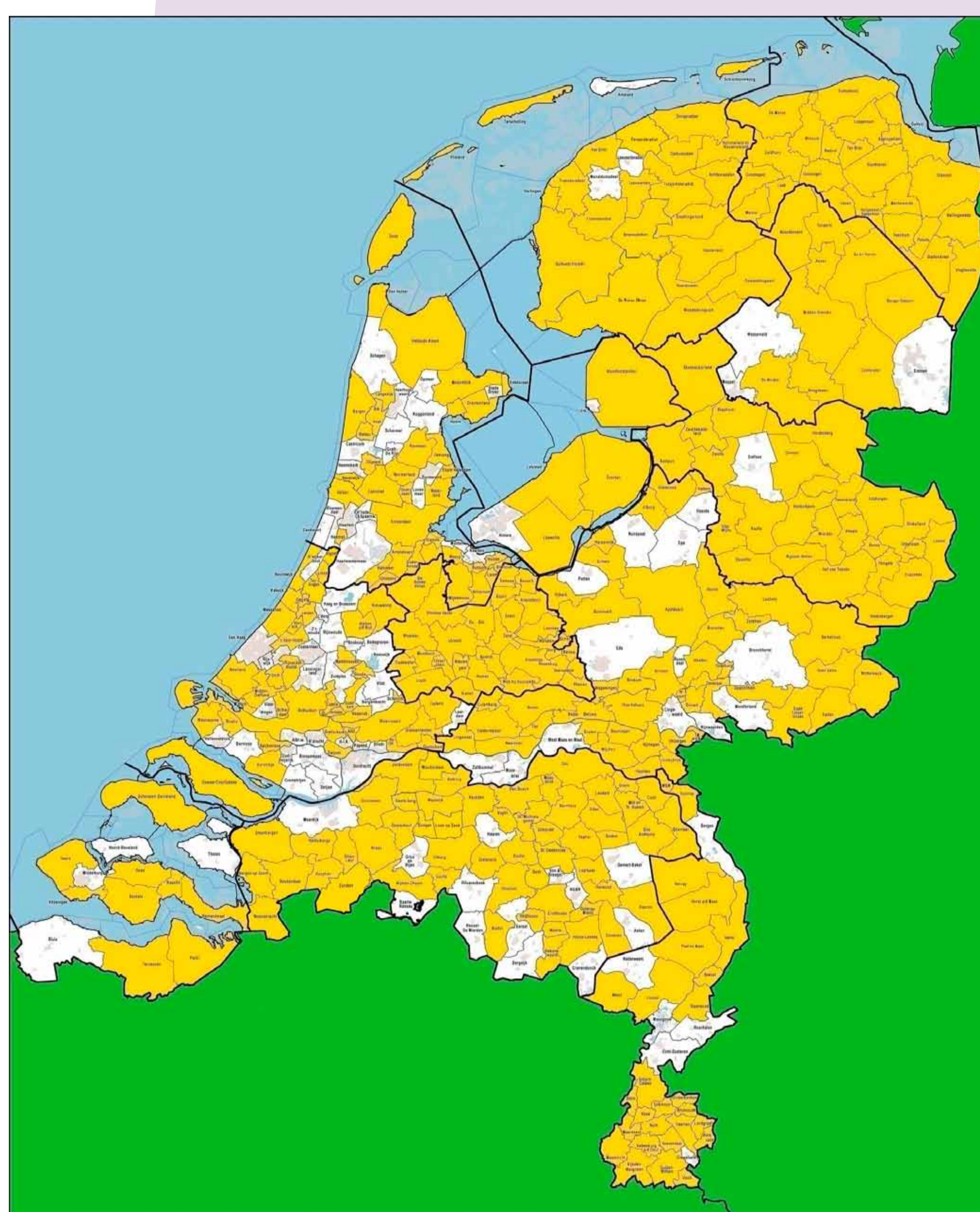
De kaart van Nederland kleurde in rap tempo geel, naarmate meer burgemeesters de oproep voor een rechtvaardig kinderpardon ondertekenden.

Als na heel veel jaren dan toch een definitieve negatieve beslissing valt, komen er protesten vanuit diezelfde samenleving tegen mogelijke uitzetting van zo'n gezin naar een 'land van herkomst'; de kinderen zijn immers vaak óf in Nederland geboren óf hier als baby of peuter gekomen. Ze zijn in ieder geval hier geworteld.