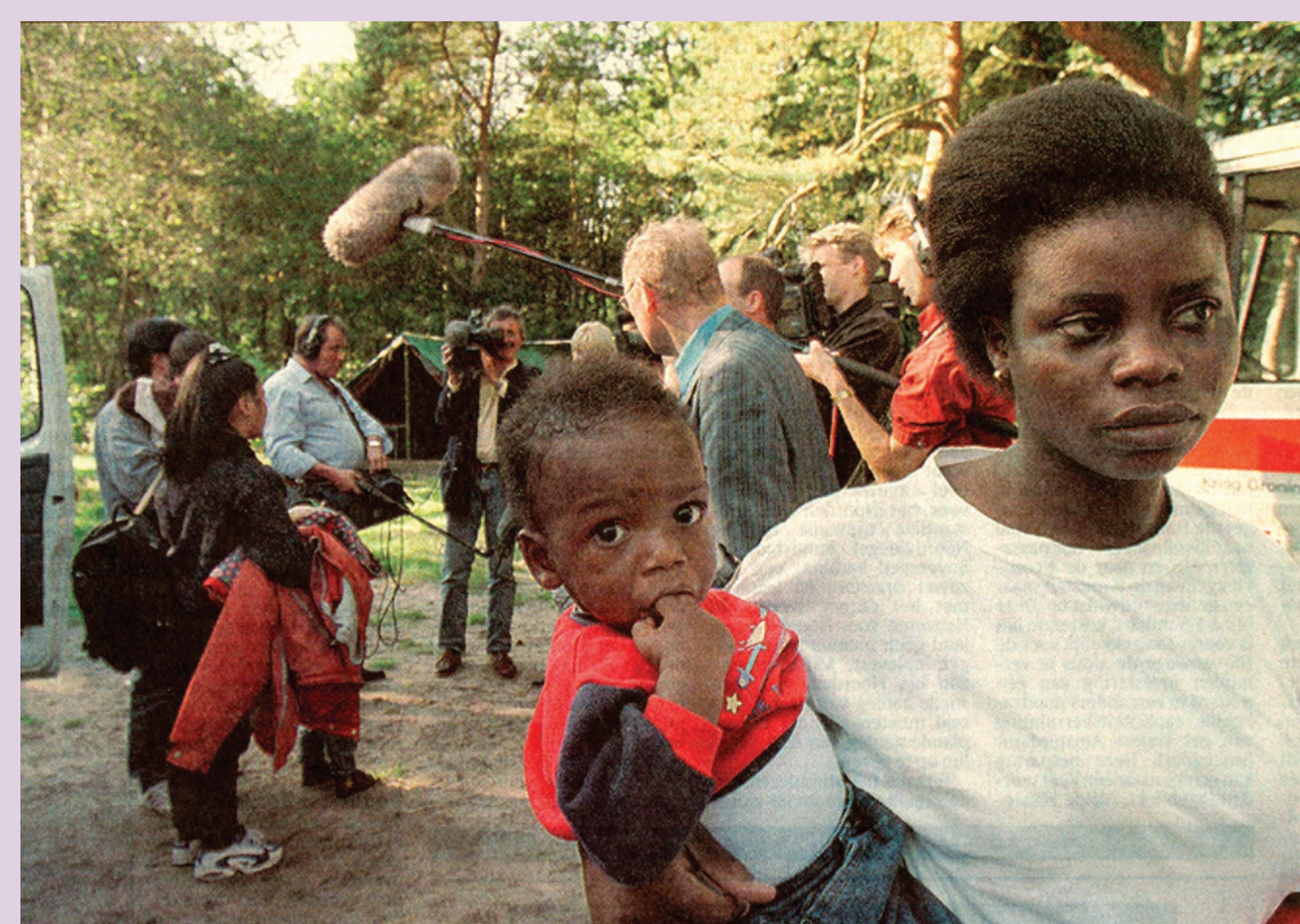
Drents Dagblad 23.09.1997

Van 1996 tot 1998 houdt de Raad van Kerken een campagne 'Voor een humaan en rechtvaardig asielbeleid'. In het kader van deze campagne wordt in september 1997, samen met INLIA en de kerken van Beilen en omgeving, een tentenkamp in de bossen van Dwingeloo opgericht. Doel is opvang te bieden aan een groep asielzoekers en daarmee de aandacht te vestigen op het probleem van de uitgeprocedeerde TOV'ers ('technisch onverwijderbare vreemdelingen'). TOV'ers kunnen niet naar het land van herkomst terug, zoals Chinezen, aan wie de overheid geen reisdocumenten verstrekt of Palestijnen die door Libanon niet als onderdanen worden erkend. Het zes weken durende tentenkamp zorgt voor een golf van publiciteit; berichtgeving op CNN veroorzaakt internationale politieke commotie en steunbetuigingen uit alle delen van de wereld stromen binnen. In het Noorden geven zo'n 15 kerken actieve steun. Het Rode Kruis zorgt voor verwarming in de tenten en beddengoed.