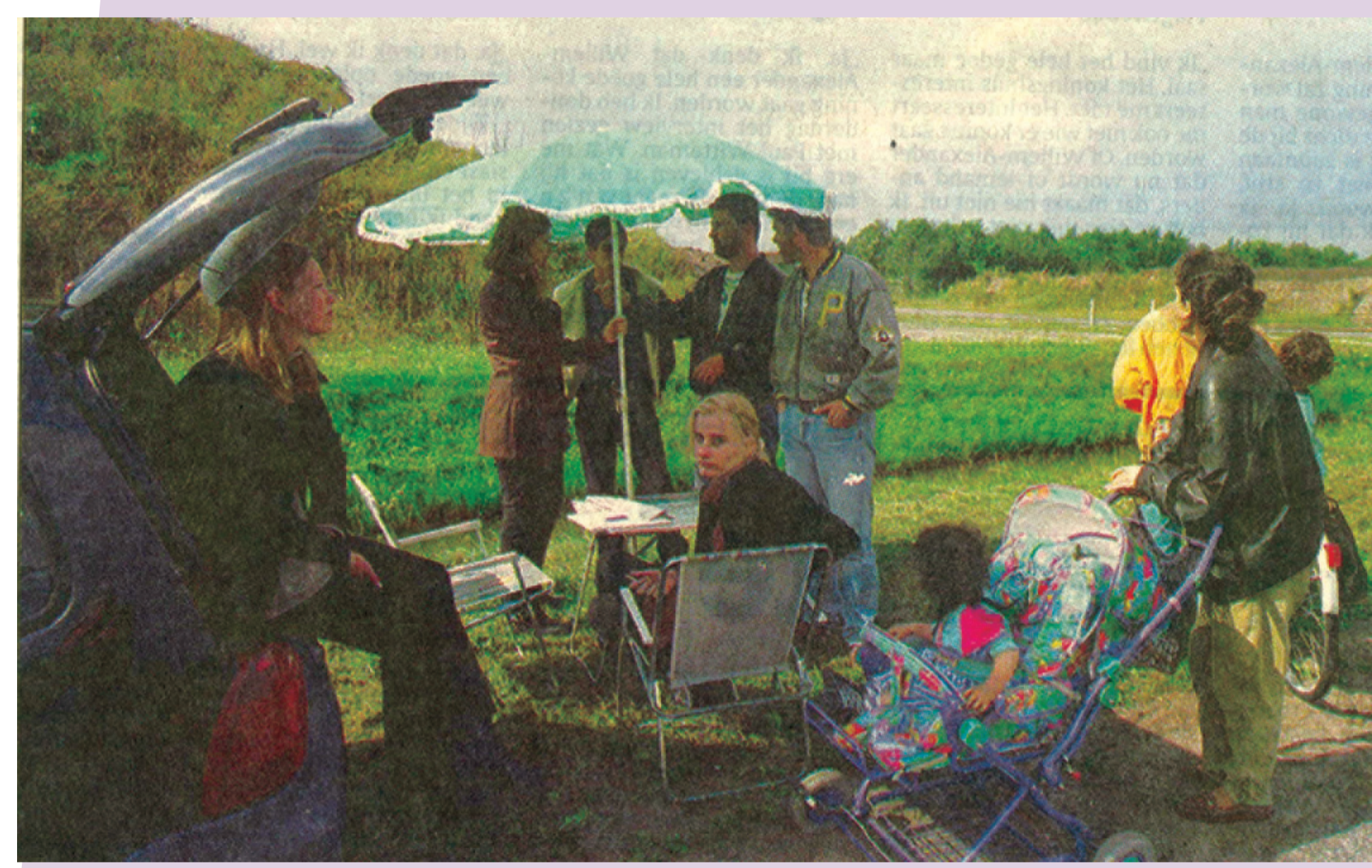
Drentse Courant 13.09.1997

In officieel taalgebruik is iemand die niet meer te traceren is 'met onbekende bestemming vertrokken' (MOB). In de praktijk groeit echter het aantal illegalen dat op straat belandt. In het jaar 2000 wordt Vertrekcentrum Ter Apel wegens het tegenvallende aantal uitzettingen gesloten. In 2004 wordt het centrum heropend. De nieuwe vreemdelingenwet schrijft inmiddels voor dat uitgeprocedeerde asielzoekers na 28 dagen het land moeten verlaten hetgeen veel te kort is om de terugkeer te realiseren.