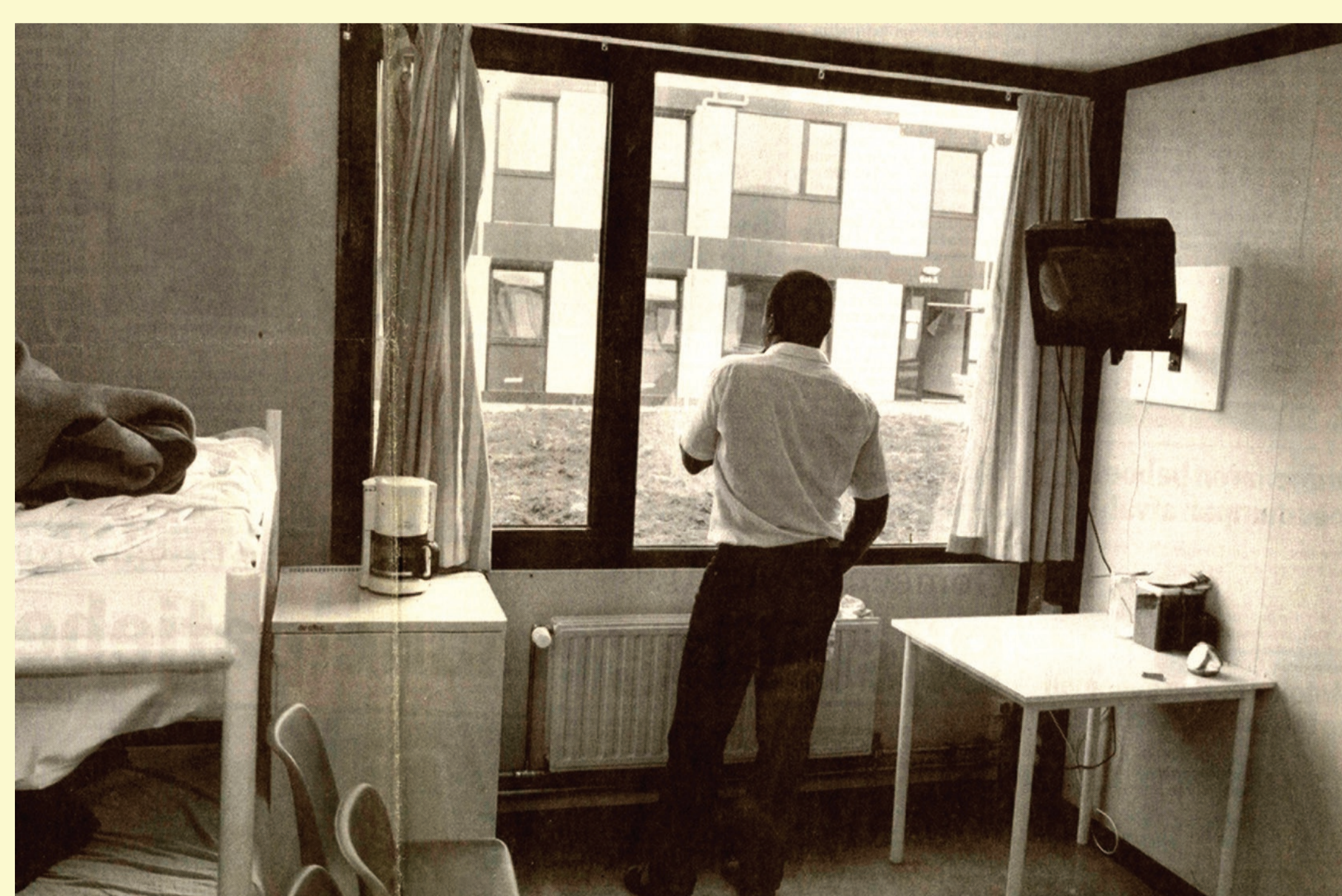
Drents Groningse Dagbladen 06.07.1996

Op gezag van het ministerie van Justitie en het COA opent in 1996 het Vertrekcentrum zijn deuren in een voormalig NAVO wapendepot in Ter Apel. Uitgeprocedeerde asielzoekers worden daar opgevangen. Binnen drie maanden moeten zij terugkeren naar hun land van herkomst. Doen zij dat niet binnen de gestelde termijn dan worden zij uit de voorzieningen gezet. Slechts een klein percentage van de vluchtelingen komt daadwerkelijk ook in Ter Apel aan, maar het merendeel duikt onder uit angst voor de uitzetting of opsluiting in vreemdelingenbewaring.