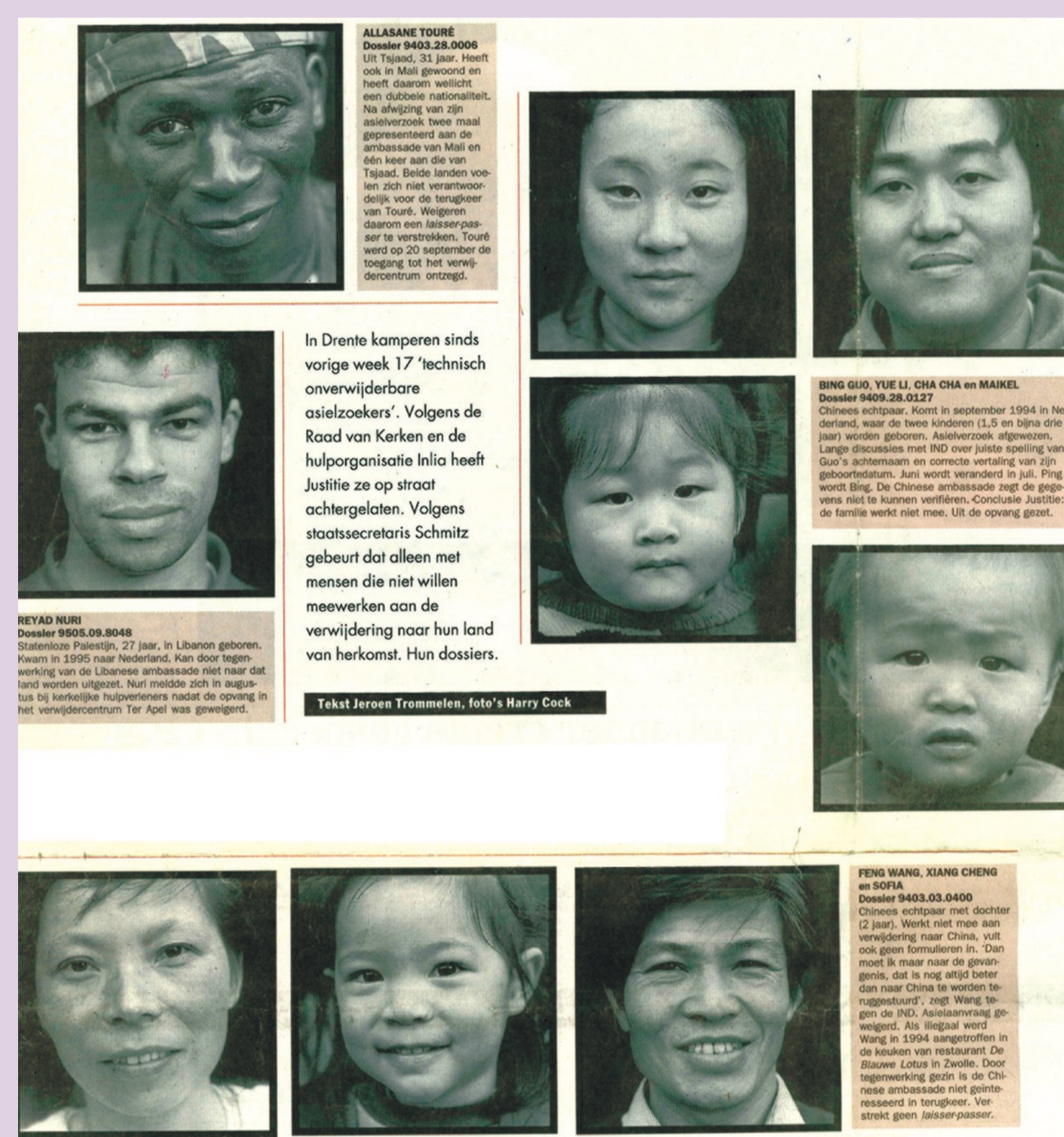
de Volkskrant 02.10.1997