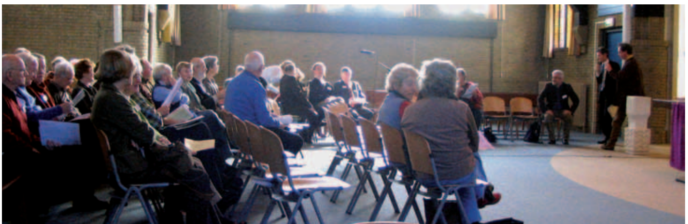
Een workshop die tijdens de landelijke Charterdag wordt gehouden.