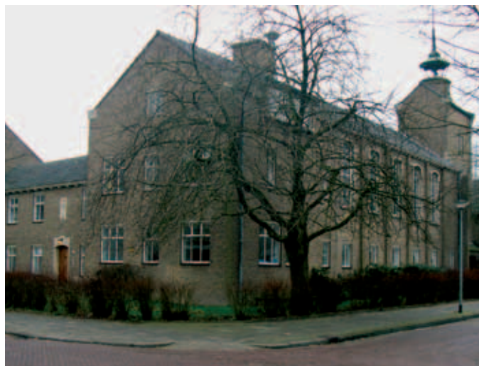
Projectencentrum en Noodopvang Mariënholm aan de Merwedestraat.

In 2003 realiseerde toenmalig Minister Verdonk een beperkte pardonregeling die onvoldoende recht deed aan een toen reeds bestaand maatschappelijk probleem. Samen met Vluchtelingen Organisaties Nederland (VON) hebben we toen al gepleit voor een pardonregeling voor mensen die onder de oude vreemdelingenwet (voor 1 april 2001) asiel aanvroegen in Nederland. In 2007 is deze pardonregeling uiteindelijk tot stand gebracht. INLIA en LOGO hebben een zeer actieve rol vervuld bij de totstandkoming én in de uitvoering van deze pardonregeling. Samen hebben wij onder andere zitting genomen in de zogeheten 'informele expertgroep' van Justitie, waarin verschillende partijen zijn betrokken bij totstandkoming en de begeleiding van de uitvoering van de regeling. Tevens is de website www.pardonnu.nl door INLIA, LOGO en Vluchtelingenwerk tot stand gebracht. Deze site werd maandelijks door tienduizenden bezocht. Op de site is veel gedetailleerde informatie te vinden over de pardonregeling (o.a. een 'Jip-en-Jannekeversie' van de regeling).